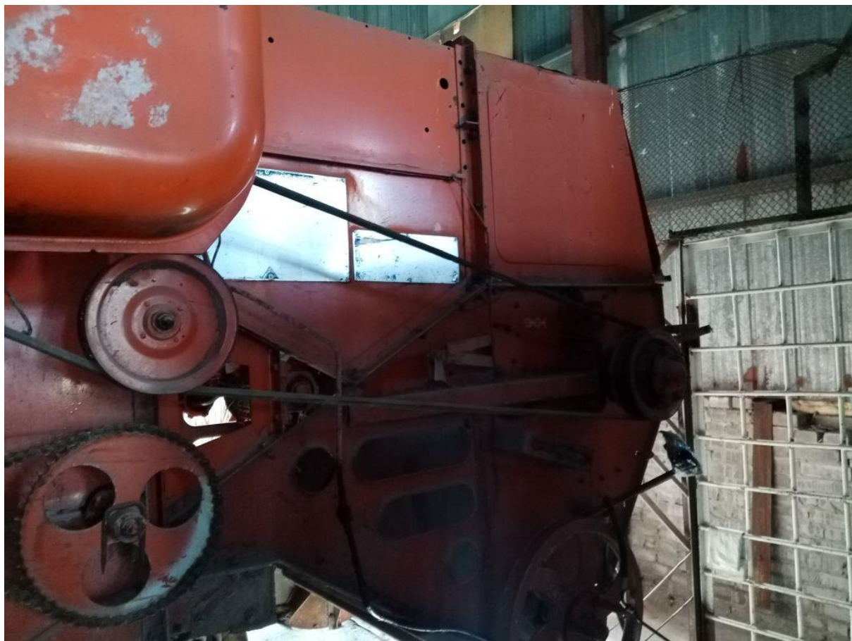
Фото 1-6. Внешний вид оцениваемой машины