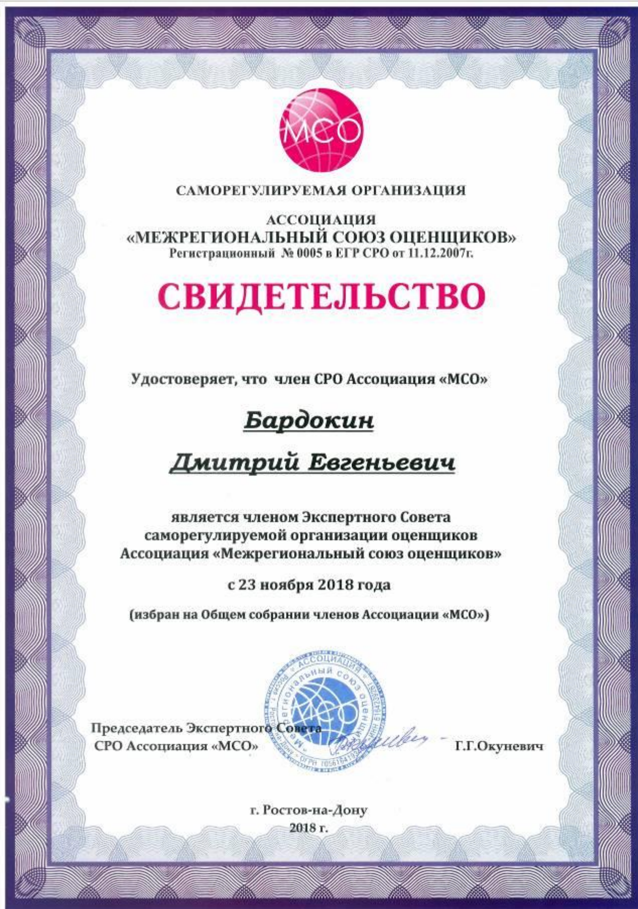
Рисунок 2 Свидетельство Эксперта СРО, удостоверяет, что член СРО Ассоциации «МСО», является членом Экспертного Совета саморегулируемой организации оценщиков с 23.11.2018;