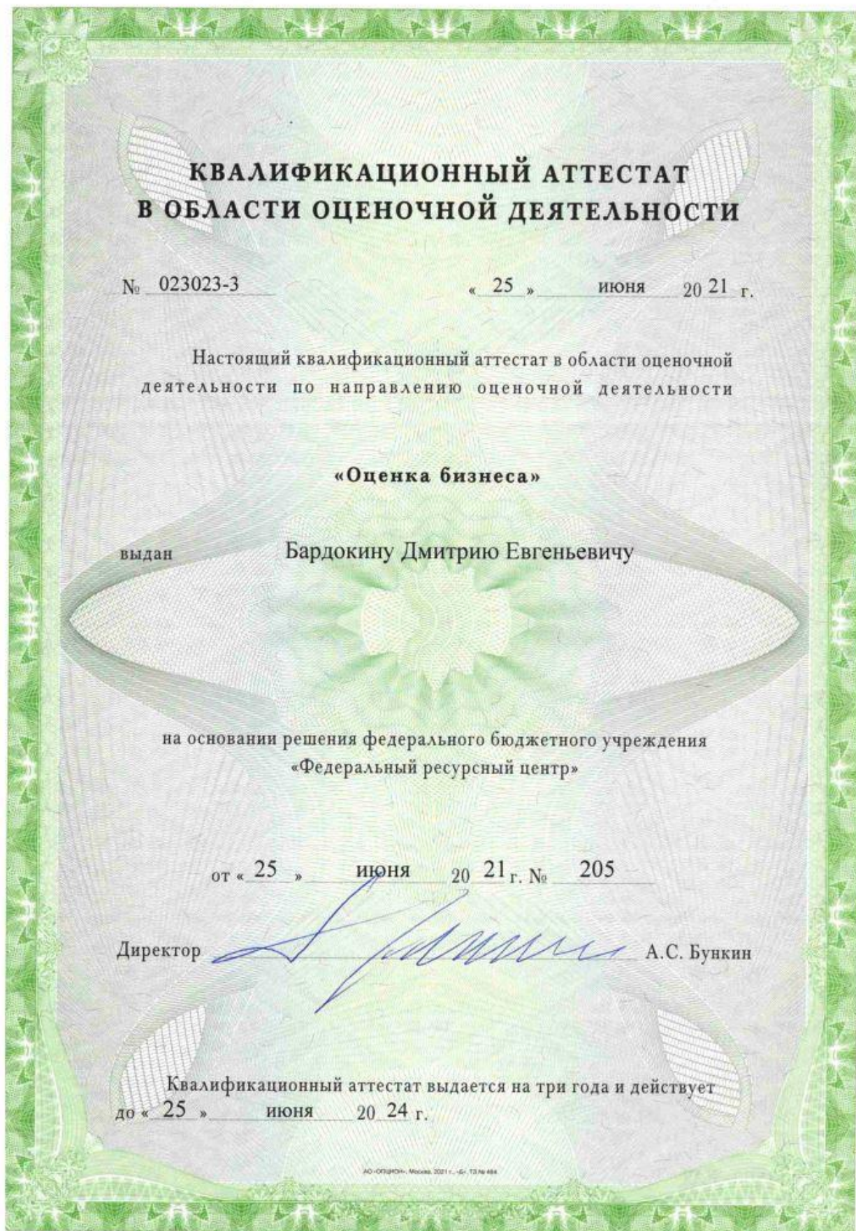
Рисунок 7 Квалификационный Аттестат в области оценочной деятельности по направлению оценочной деятельности «Оценка бизнеса» № 023023-3 от 25.06.2021 г.