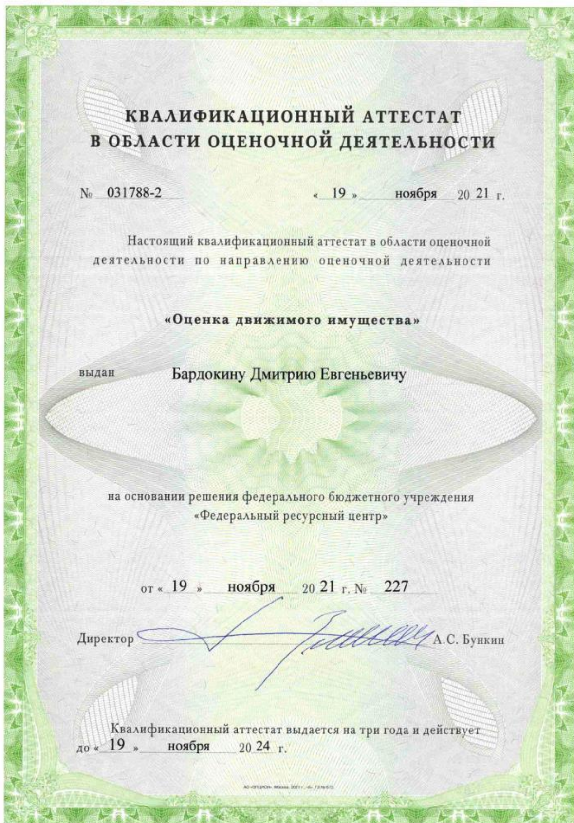
Рисунок 6 Квалификационный Аттестат в области оценочной деятельности по направлению оценочной деятельности «Оценка движимого имущества» № 031788-2 от 19.11.2021 г.;