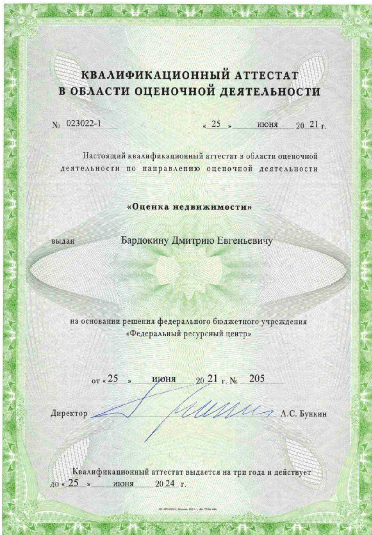
Рисунок 5 Квалификационный Аттестат в области оценочной деятельности по направлению оценочной деятельности «Оценка недвижимости» № 023022-1 от 25.06.2021 г.;